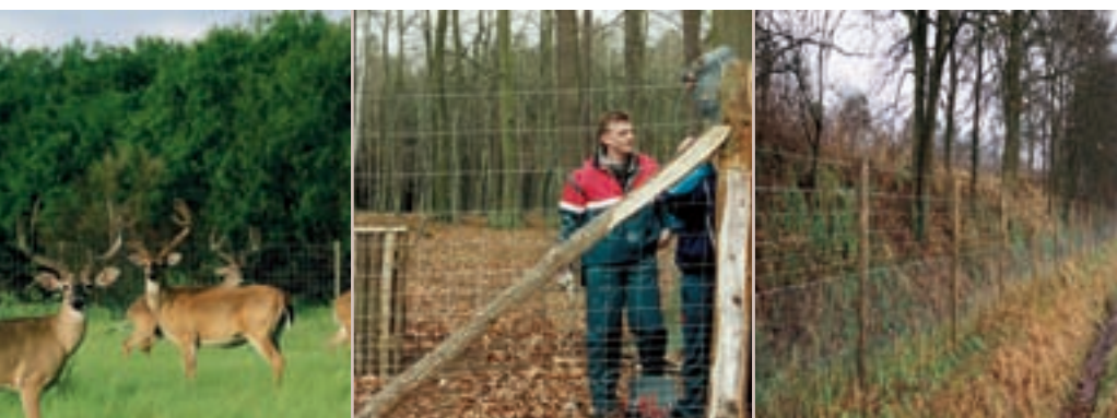
Ursus Heavy AS

Betafence NV Sales Benelux Deerlijkstraat 58A B-8550 Zwevegem BE: Tél.: +32 (0)56 73 46 46 BE: Fax: +32 (0)56 73 45 45 info.benelux@betafence.com www.betafence.com