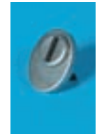
Protection de serrure