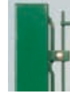
Strip de fixation + pièces de fixation spécifiques