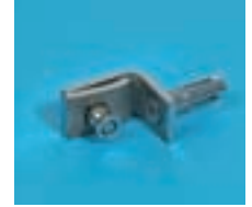
Pièce de connexion entre le poteau et panneau de clôture